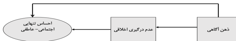
شکل ۱- مدل مفهومی پژوهش

متغیرهای پژوهش، تاکنون پژوهشی نقش واسطه‌ای عدم درگیری اخلاقی در بین ذهن آگاهی و احساس تنهایی در قالب یک مدل علی بررسی نکرده است، این مساله هدف پژوهش حاضر را به بررسی نقش واسطه‌ای عدم درگیری اخلاقی در رابطه بین ذهن آگاهی و احساس تنهایی اجتماعی - عاطفی رهنمون می‌سازد. بر اساس مبانی نظری و پیشینه تجربی پژوهش چنانچه ذکر گردید برای اینکه شخص احساس تنهایی اجتماعی - عاطفی کمتری کند، یک سلسله مکانیزم‌های علی وجود دارد که اگر این نظم علی به هم بخورد احتمال تجربه احساس تنهایی اجتماعی - عاطفی تغییر می‌کند. در این پژوهش به بررسی این نظم علی در قالب یک مدل علی پرداخته می‌شود، که تاکنون مورد بررسی قرار نگرفته است. بدین صورت که میزان واسطه‌گری عدم درگیری اخلاقی در بین ذهن آگاهی به عنوان آغازگر رفتار و احساس تنهایی اجتماعی - عاطفی به عنوان پیامد رفتاری مورد بررسی قرار می‌گیرد. بنابراین فرضیه پژوهش به این صورت طرح‌ریزی می‌گردد: «عدم درگیری اخلاقی نقش واسطه‌ای در بین ذهن آگاهی و احساس تنهایی اجتماعی - عاطفی دارد.» مدل مفهومی پژوهش در شکل ۱ آمده است.